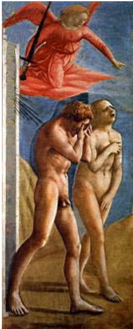
¿Expulsión del Paraíso?, (1424-28) Autor: Masaccio Iglesia del Carmine de Florencia Fresco 208 x 88 cm. Renacimiento Italiano

Desde el pasado mes de Julio CC.OO. , junto algún otro sindicato, hemos solicitado de Recursos Humanos información sobre la cantidad de personas afectadas y la formación que se les iba a proporcionar. El viernes 22 de Octubre, tres meses y medio después, cuando ya han empezado a salir a Oficinas los compañeros, tienen a bien informarnos.